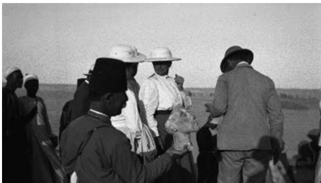
La cour de Saxe découvre le site d'Amarna et ses œuvres d'art (décembre 1912).

Tell el-Amarna en Moyenne-Égypte, début décembre 1912. Le duc Johann Georg de Saxe parcourt l'Égypte en compagnie de son épouse, la princesse Maria Immaculata de Bourbon-Sicile et de quelques autres représentants de la haute société saxonne. Photographe passionné, le prince est muni de son appareil et il photographie de manière obsessionnelle les régions traversées. L'Université de Fribourg-en-Brigau conserve aujourd'hui des centaines de clichés originaux inédits, d'une grande netteté, qui rendent compte de ce voyage, de la fascination pour l'Égypte au début du xx e siècle et de la passion pour la photographie du prince 6 . Le 6 ou le 7 décembre 1912, le groupe de voyageurs arrive à Tell el-Amarna sur la rive orientale du Nil. Ici, il y a près de 3500 ans, vers 1340 avant Jésus-Christ, le pharaon Aménophis IV (Akhenaton) avait édifié sa nouvelle capitale. Ici, depuis 1911, était à l'œuvre l'égyptologue berlinois Ludwig Borchardt dans le cadre d'une grande campagne de fouilles financée par la Deutsche Orient-Gesellschaft grâce au richissime industriel berlinois James Simon.