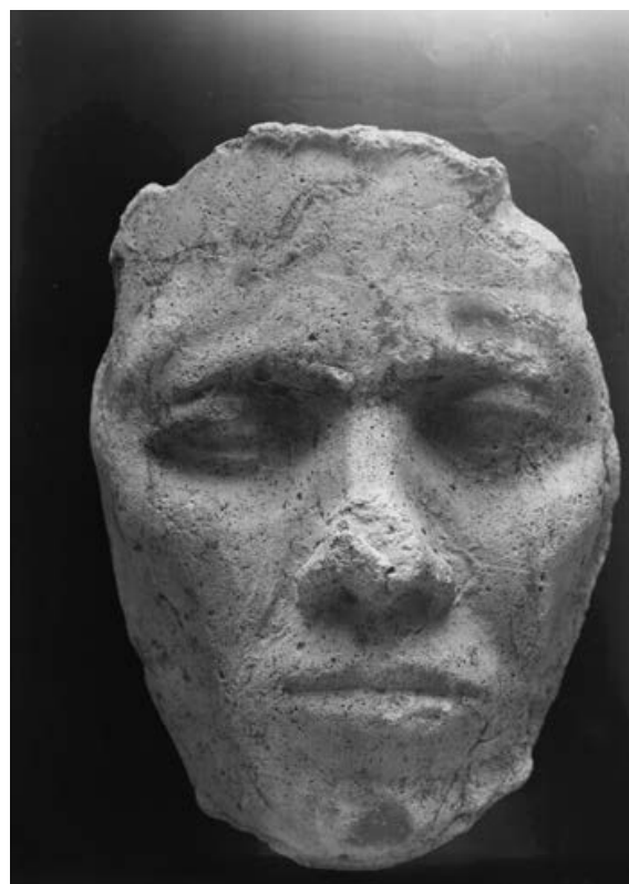
Membres de la cour d'Aménophis IV, Tell el-Amarna. Berlin, Musée égyptien (Staatliche Museen zu Berlin - Preussischer Kulturbesitz).